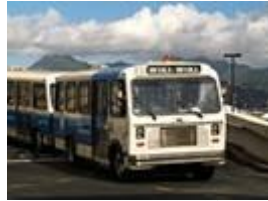
navette Wiki Wiki, aéroport d'Honolulu