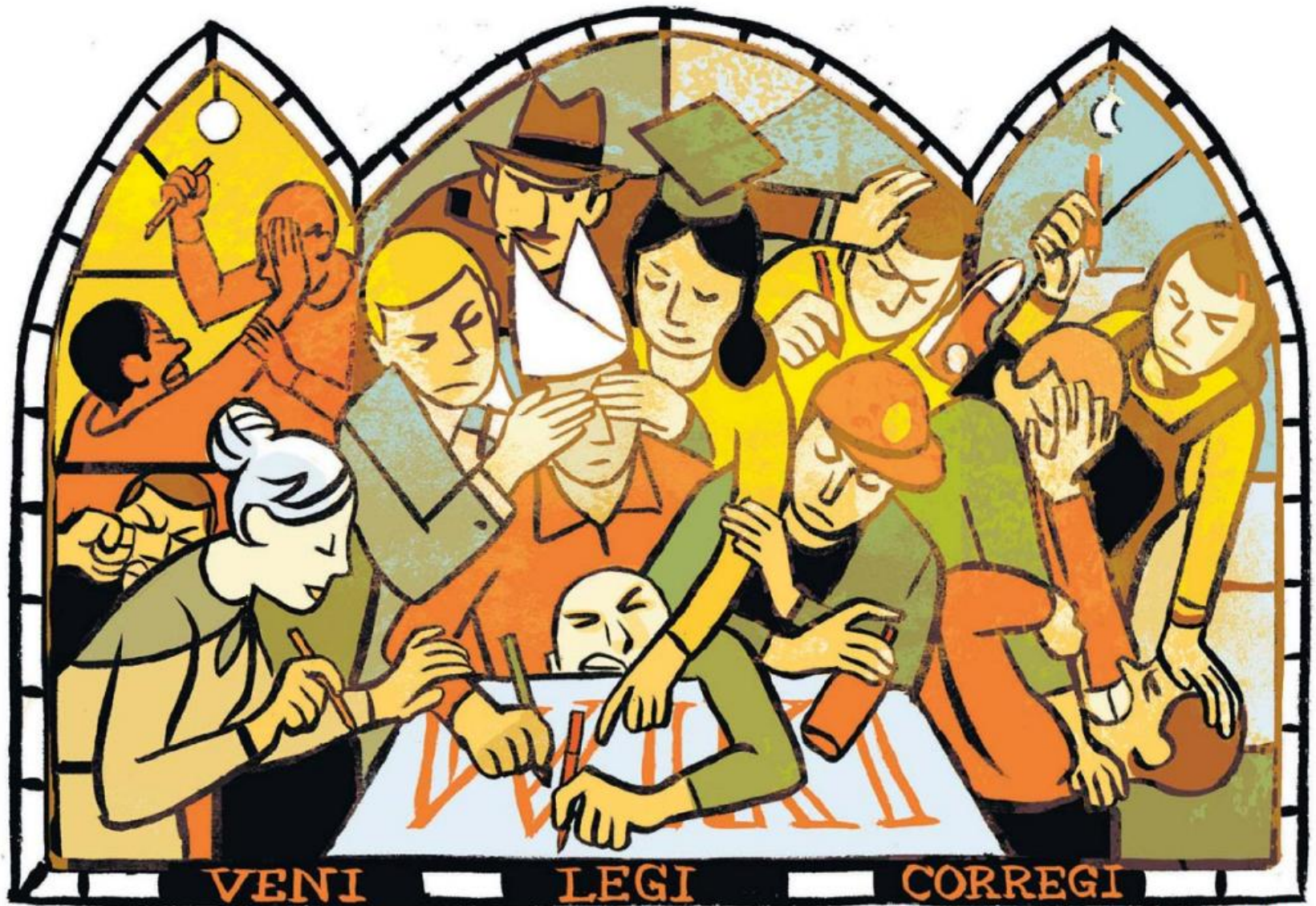
ILLUSTRATION: OLIVIER BALEZ